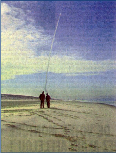
Unua pafo de misilo « M 51 »

La 9-an de novembro 2006, franca armeo efektivigis la unuan pafon de misilo « M51 ». Tiu nova strategia