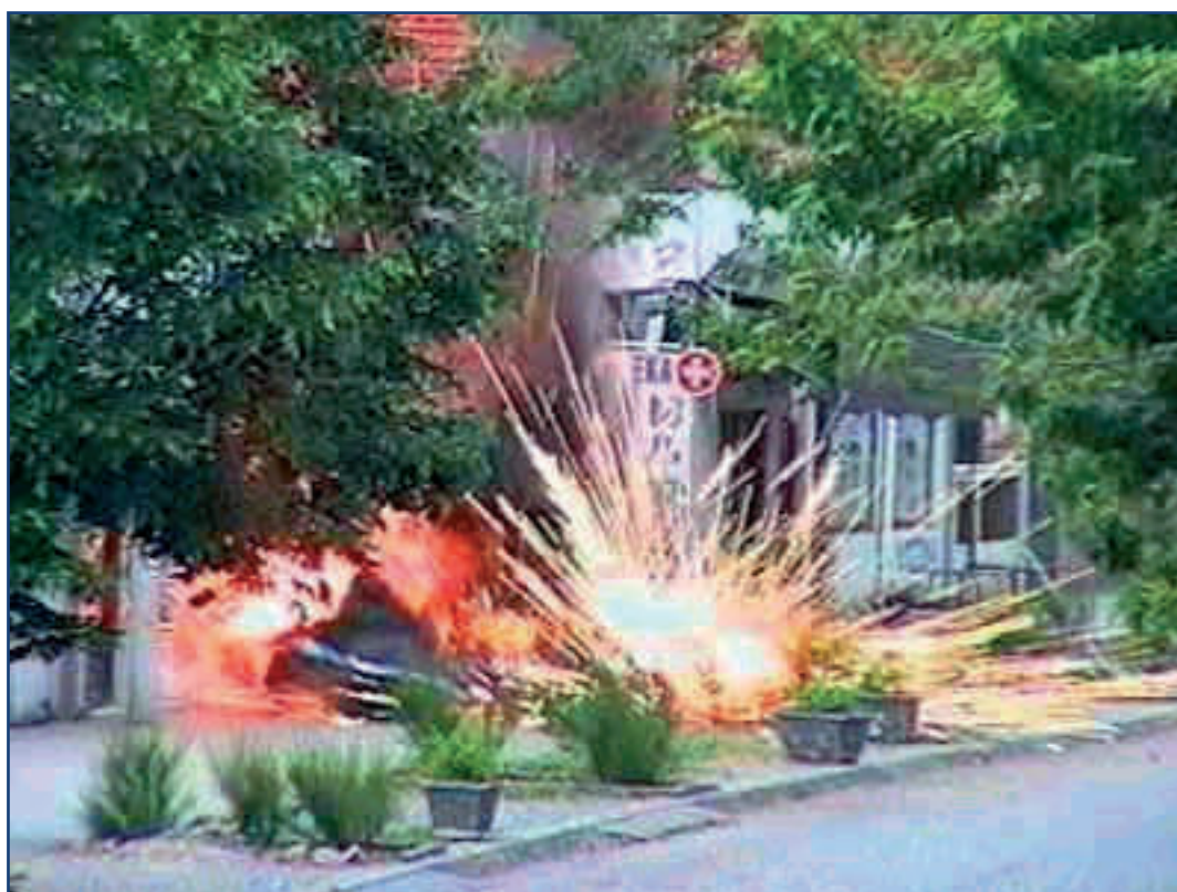
Eksplodo de pafaĵojeta bombo