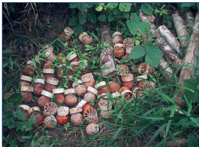
Pafaĵetoj sur tersurfaco

Ni informas la membrojn de S.A.T. ke C.M.C. - Monda Koalicio kontraŭ la pafaĵetoj el bomboj akceptis la aliĝon de S.A.T. al la Koalicio. Ni agu kontraŭ tiuj armiloj kiuj blinde frapas eĉ post la fino de la milito.