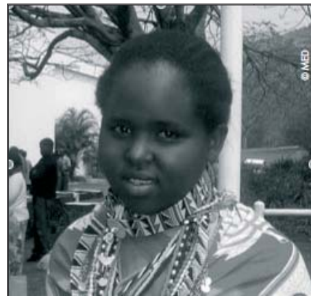
La beleco de la inoj Masai

La knabino bonŝance fine svenas kaj makabra operacio povas daŭri plu. Ĉifoje estas tranĉitaj vulvaj lipetoj kaj lipoj,