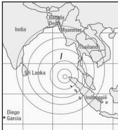
Skema prezento de la evento - tertremo provokanta Cunamon

Ekzistas multaj duboj kaj diskutoj pri la valoro de ĉi tiuj detektaj sistemoj. Eĉ bone funkciantaj ili lasos tro malmulte da tempo por alpreni rapidajn decidojn