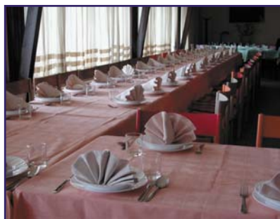
Jen la manĝejo...