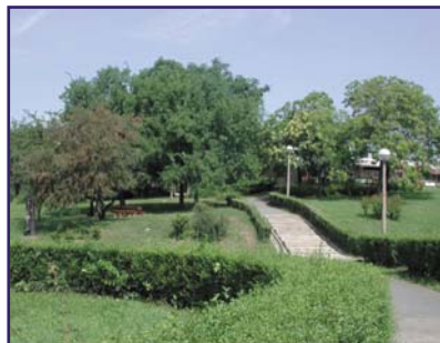
La kongreso okazos en verda kaj agrabla loko