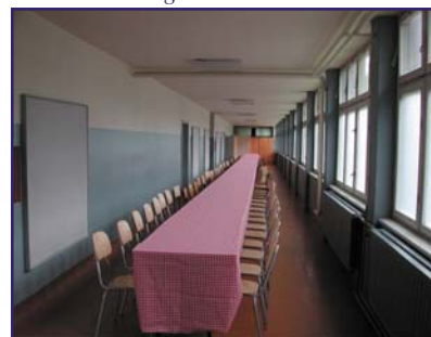
Ankaŭ la koridoro estas uzebla