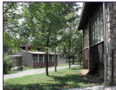
En la verdejo troviĝas dometoj