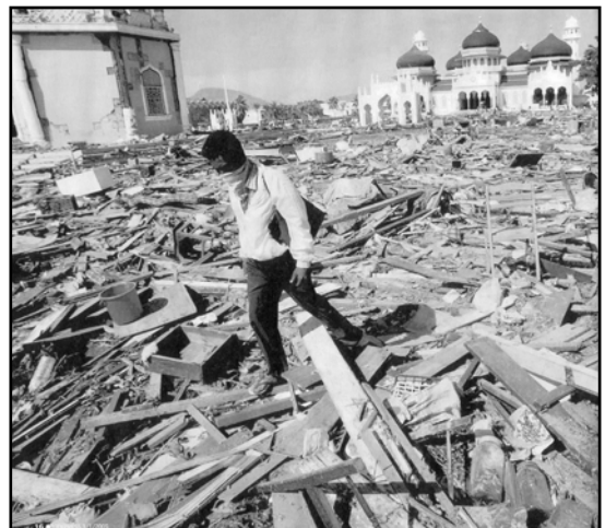
Terura konsekvenco de Cunamo kun pli ol 150000 mortintoj

troviĝis multegaj turistoj, do valoraj homoj, kaj feliĉe, rapide, diru 2 tagojn post la katastrofo, la televido jam povis montri ke la povraj putinoj el la regionoj jam denove servis al la kapricoj de la turistoj. Ke la strandoj jam denove estas purigitaj de kadavroj, ke la aspekto estis kiel diris maljuna turistino “paradiza”. Kiu el vi legis ion en la popola presoj pri la katastrofoj kiujn kaŭzis Cunamo en Somalio, Kenio, Tanzanio aŭ sur Seŝeloj?