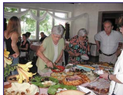
... kaj la manĝoj