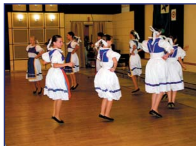
Junulara folkloro grupo