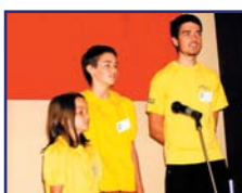
Junaj Beogradanoj kantis por ni.