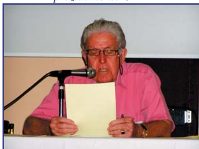
Dum prelego - k-do Kep Enderby