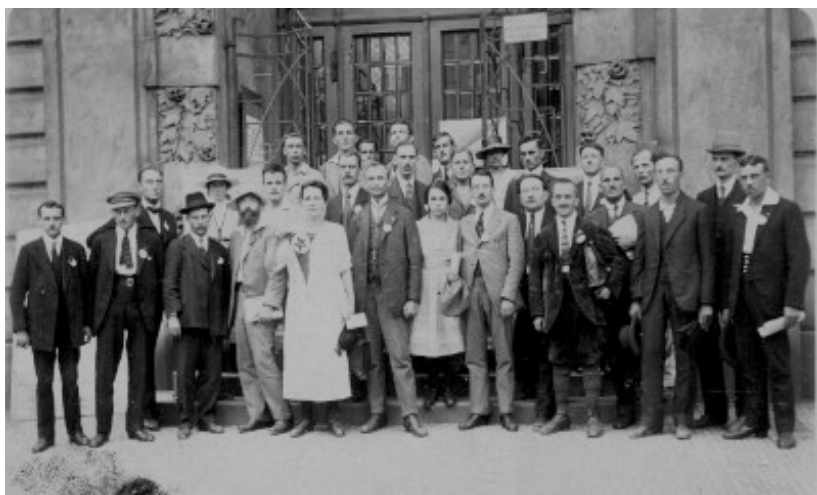
Partoprenantoj de la unua SAT-kongreso (Prago) 1921

La priorganizaj problemoj traktitaj de Lanti en la diversaj numeroj de 1920 kaj 1921 estas, kiel jam dirite, legeblaj ankoraŭ hodiaŭ en la broŝuro « For la Neŭtralismon ! », kies aperon fama revoluciulo, Henriko Barbus (Barbusse) akompanis per jenaj paroloj : « La burĝaj kaj mondumaj esperant-