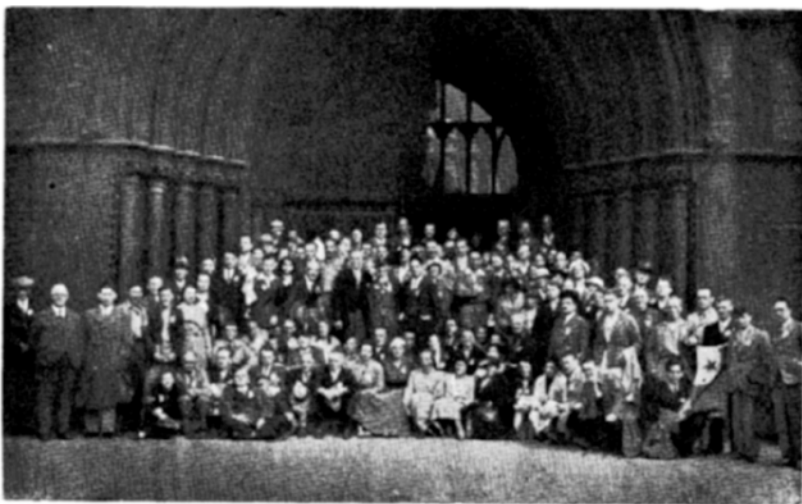
Kongresanoj en Manĉestro antaŭ la Urbdomo

La bilanco, unuafoje de post jaroj, montras profiton. Ĉe la sojlo de la Kongreso, en la julia n-ro de Sennaciulo , la PK vokas ankoraŭfoje, fruntpaĝe, por lasta fortostreĉo por forigi tute la « Breĉon », kiun lasis la malbelaj jaroj de la skismo en la organizo, kaj – ne laste – ankaŭ la faŝismo en Germanio.