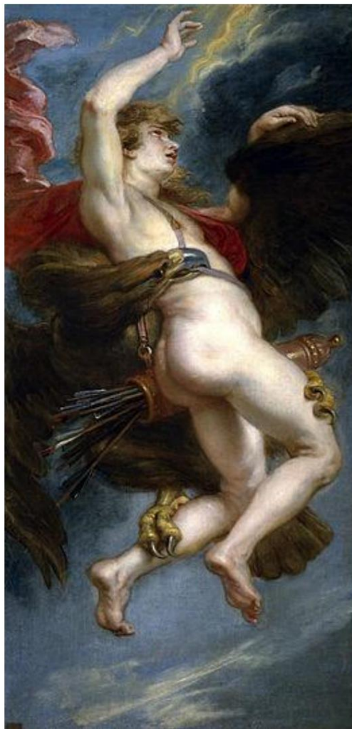
Pierre-Paul Rubens (1577-1640) - La Seksperto de Ganimedo (1638) - Prado-Muzeo

Civitanoj, civitanoj, kamaradoj, karaj amikoj,